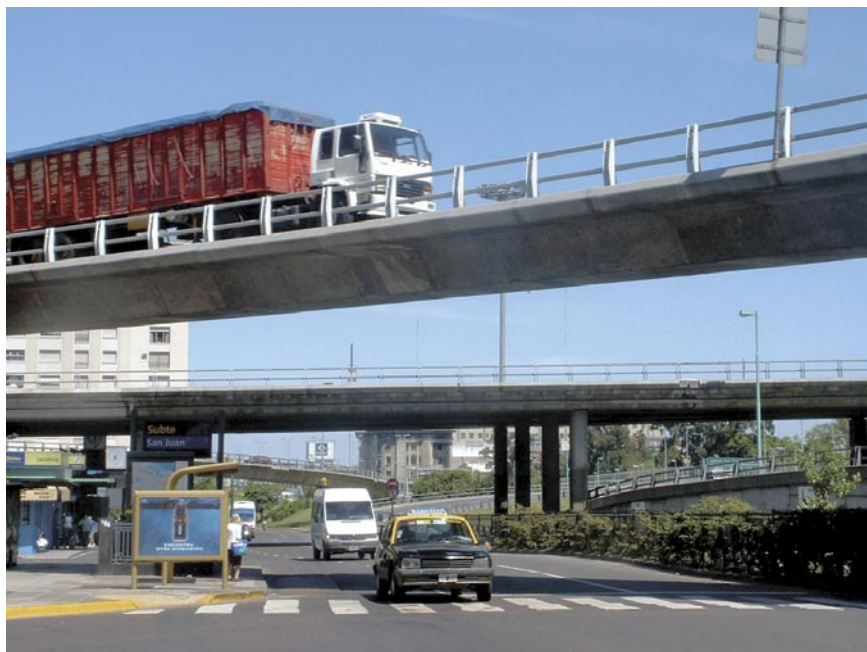
Fig. 3 Las vías elevadas en el centro de la ciudad de Buenos Aires, tales como la aquí ilustrada Carretera Ezeiza sobre la estación de metro de San Juan, no resultaron ser empresas exitosas del sector privado.