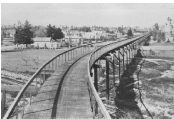
Fig. 7 La “ciclo vía” de Horace Dobbins alrededor del año 1900.