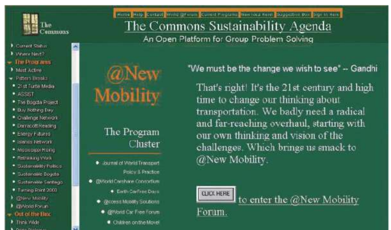
图 4： www.ecoplan.org 链接 http://uncfd.org ，有活动资源 (www.ecoplan.org)