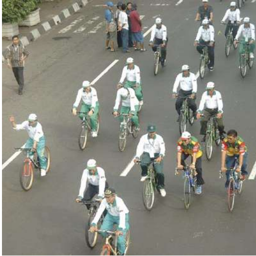
图 8: 苏腊巴亚市议会的领导带领议会工作人员参加 2002 年 5 月 30 日的无汽车日活动。(Karl Fjellstrom, 2002.3)