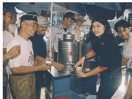
图3: www.ecoplan.org 链接 http://uncfd.org , 有活动资源 (www.ecoplan.org)