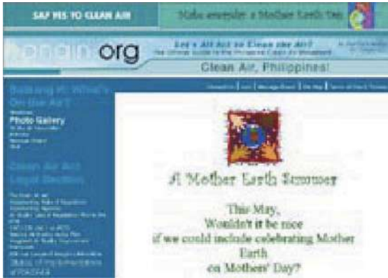
图 2： 拯救空气，参加空气净化，马尼拉 (www.hangin.org)